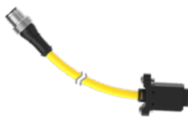
DELSE-51D (5 broches)