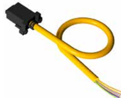
RDLS-515D (5 broches)