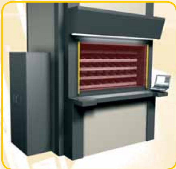
▲ Stockage vertical